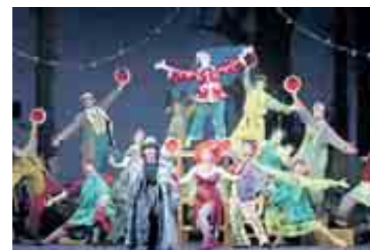
Una scena di "Pinocchio, Il Grande Musical"

► Debutta nel weekend a Senigallia Arriva "Pinocchio Il Grande Musical"